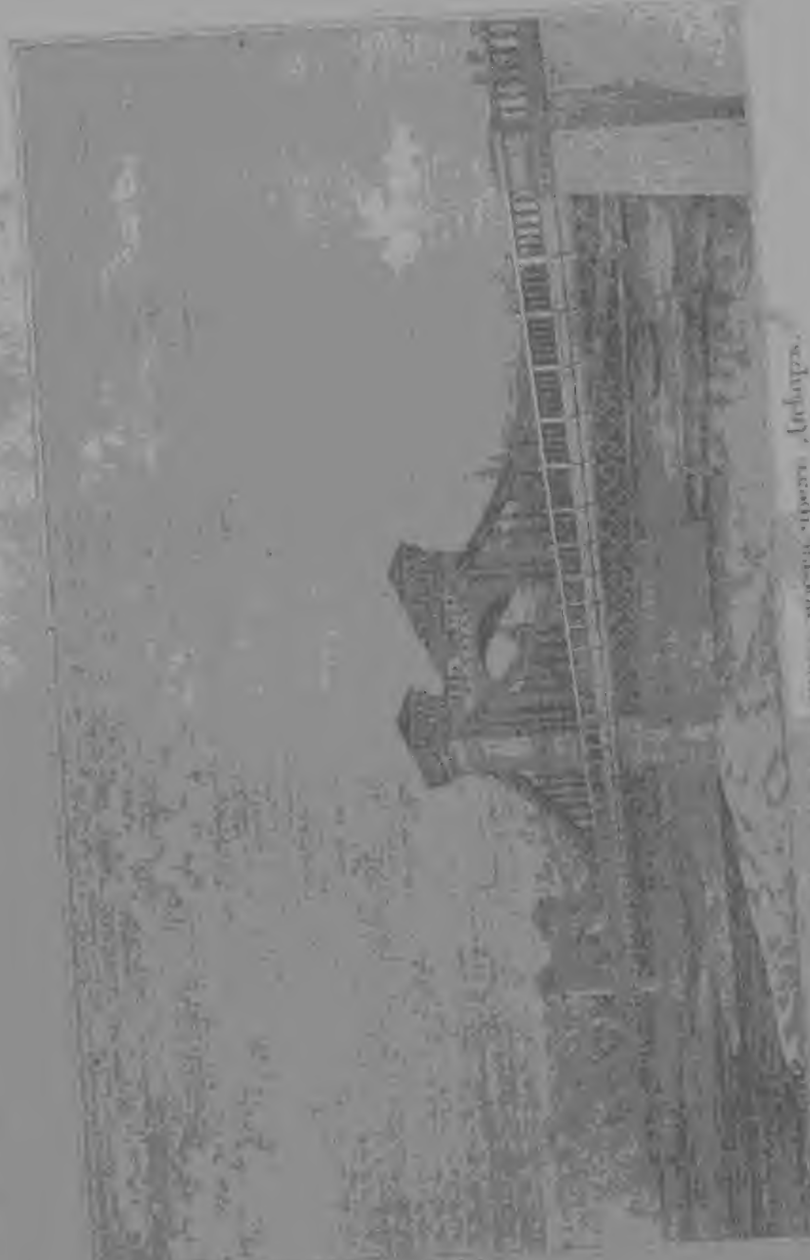
Fig. 6. Народно-просветителско здание в Скопје, Македонија.